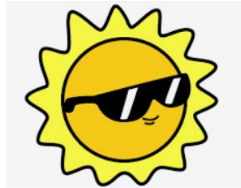
EL SOL MOLA MOLT.