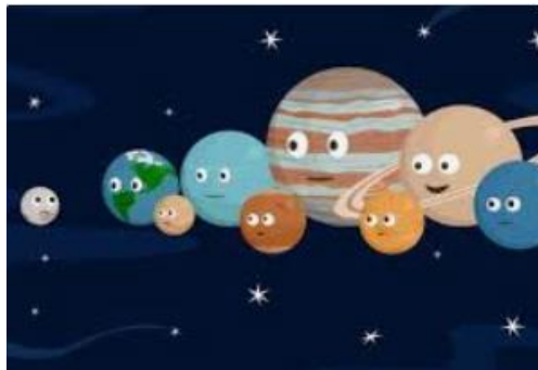
PLUTÓ ÉS PETITÓ..