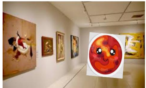
A MART LI AGRADA L'ART..