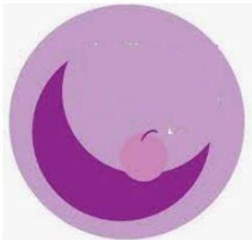
LA LUNA ÉS UNA PRUNA.