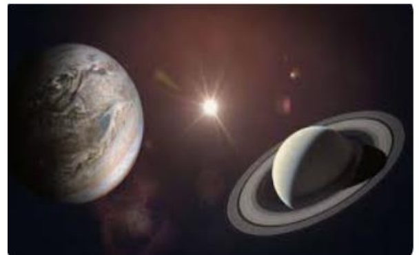
SATURN ÉS FORÇA LLUNY..